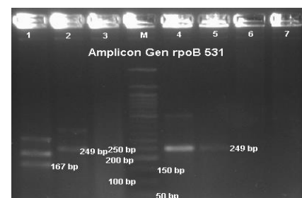
Gambar 2. Hasil Visualisasi gen rpoB Ser531Leu

Semua sampel yang mengandung DNA M. tuberculosis kemudian dilanjutkan dengan Multiplex PCR untuk mengetahui ada atau tidaknya mutasi yang terjadi pada gen rpoB Ser531Leu . Deteksi mutasi pada gen rpoB Ser531Leu menggunakan primer rpoB531 . Primer rpoB531 akan mengenali dan memotong sekuens alel yang wild type dan menghasilkan dua pita yaitu pada 167 bp dan pada 249 bp. Adanya mutasi pada produk PCR akan menghasilkan satu pita pada 249 bp. Mutasi ini disebabkan perubahan pada sekuens nukleotida, sehingga primer yang spesifik untuk gen rpoB Ser531Leu tidak dapat mengenalinya. Visualisasi dilakukan dengan gel agarosa 2% yang mengandung ethidium bromida 10% dan dielektroforesis dengan voltase sebesar 80 V selama 60 menit. Hasil visualisasi dapat dilihat pada gambar 2.