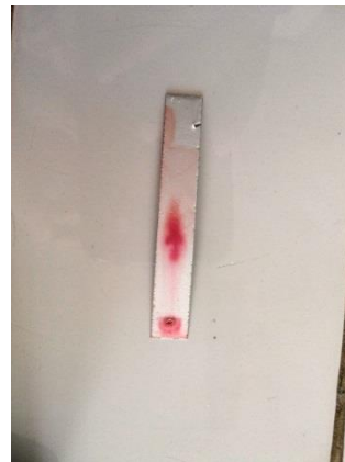
Gambar 4.1. Hasil uji KLT pada ekstrak bunga kembang sepatu

Uji KLT dilakukan untuk menentukan golongan senyawa yang aktif. Prosedur kerja uji KLT yaitu, ekstrak 1 mg dimasukkan kedalam botol vial lalu ditambahkan pelarut methanol sebanyak 1 ml, aduk hingga rata. Kemudian dengan menggunakan pipet kapiler, ekstrak yang telah dilarutkan ditotolkan pada plat silica gel F254 sebanyak 2 kali tolotan, dikembangkan dengan fase gerak yang sesuai, semprot dengan larutan H 2 SO 4 . Letakkan di atas hot plate, lalu amati bercak warna yang muncul, seperti gambar di bawah ini: