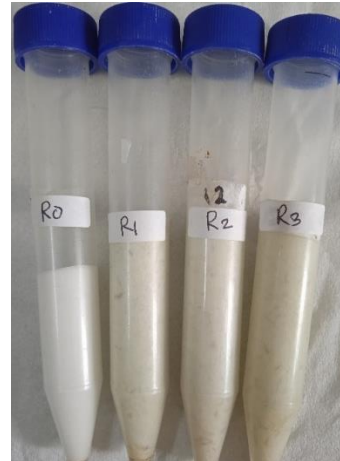
Gambar 3. Hasil centrifugal test

Centrifugal test dilakukan pada semua sediaan krim body scrub yang bertujuan untuk melihat kestabilan fisik dari krim tersebut (Yanuarti, 2017). Hasil uji Centrifugal test dari sediaan body scrub bubuk rumput laut B. forbesii dan kencur ( K. galanga ) menunjukkan sediaan krim body scrub tetap stabil dan tidak adanya pemisahan fase krim. (Gambar 3).