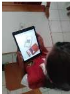
Gambar 3 Siswa memindai Kode QR pada kartu gambar

Dari permasalahan tersebut, peneliti berdiskusi bersama kolabolator menemukan solusi dari masalah ini seperti (1) peneliti mendampingi siswa agar dapat memindai Kode QR dan berani menekan kunci jawaban secara dalam internet, (2) peneliti membuat pertanyaan dalam bentuk yang lebih menarik seperti gambar, video dan teks singkat agar siswa mudah memahami pertanyaan (3) peneliti memberikan aturan agar pemain dari tiap kelompok harus diganti sesuai strategi kelompok masing-masing dalam memenangkan pertandingan