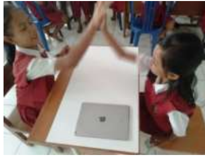
Gambar 2 Siswa memainkan PT2B Modifikasi Kode QR

belajar sangat baik terlalu dominan sehingga tidak memberikan kesempatan bagi siswa lainnya untuk tampil bertanding.