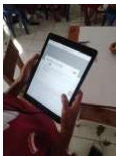
Gambar 4 Siswa menjawab soal secara daring

pemenang. Secara kelompok, tiap anggota kelompok akan berusaha mempertahankan kartu gambar dengan cara menjawab soal secara benar dan membaca materi ajar dengan baik.