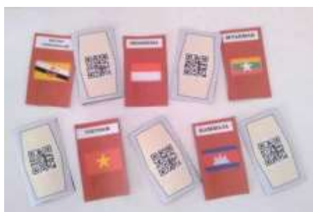
Gambar 1 PT2B Modifikasi Kode QR

Penulis memanfaatkan PT2B sebagai media pembelajaran dengan bentuk yang sama berupa kartu yang berisikan gambar bendera Negara ASEAN. Penulis juga memodifikasi sedikit fungsi dan aturan dengan menambahkan Kode QR yang berisikan pertanyaan. Kode QR yaitu kode batang dua dimensi yang berisikan suatu data, terutama data berbentuk teks. Beberapa aplikasi dari Kode QR dalam pendidikan adalah aktivitas pembelajaran: membuat buku yang mengandung Kode QR, menghubungkan dengan sumber multimedia pendidikan di internet (url) atau Youtube, memberikan informasi, menandai informasi, serta mengisi informasi pada sebuah pembelajaran (Walanda, 2012). Setiap kartu gambar berisikan Kode QR tentang budaya, ekonomi dan politik di wilayah Asia Tenggara sesuai dengan gambar bendera Negara ASEAN. Peneliti memanfaatkan Kode QR berisikan pertanyaan yang merujuk pada aplikasi google form format quiz sehingga siswa dapat menjawab pertanyaan secara dalam jaringan (daring) dengan menggunakan gawai dan internet yang disediakan oleh guru.