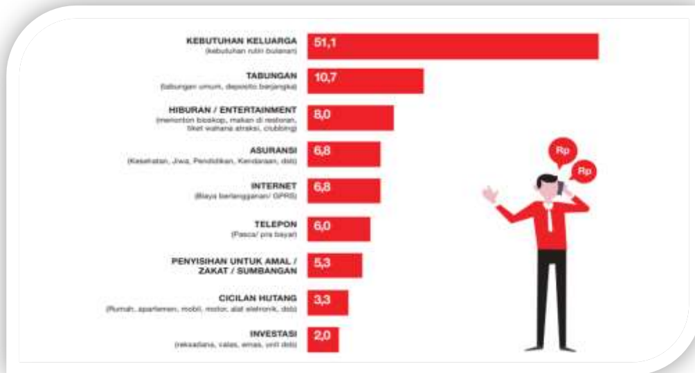
Gambar 1. Presentase Pengeluaran Milenial Selama Satu Bulan