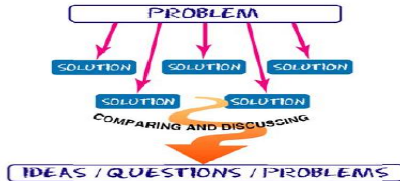
Gambar 1. Gambaran soal Open-Ended menurut Becker dan Shimada (1997)

Becker dan Shimada (Takahashi,2005) menyebutkan beberapa keunggulan berkenaan dengan pemberian soal open-ended dalam pembelajaran matematika adalah : (1) Siswa mengambil bagian lebih aktif dalam pembelajaran, dan lebih sering menyatakan ide-ide mereka. (2) Siswa mempunyai lebih banyak peluang menggunakan pengetahuan dan keterampilan matematis mereka. (3) Siswa dengan kemampuan rendah bisa memberikan reaksi terhadap masalah dengan beberapa cara signifikan dari milik mereka sendiri. (4) Mendorong Siswa untuk memberikan bukti. (5) Siswa mempunyai pengalaman yang kaya dan senang atas penemuan mereka dan menerima persetujuan temannya.