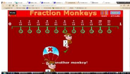
Gambar 2: Fraction Monkey

Permainan yang beralamat di www.sums.co.uk/playground/n6a/playground.htm adalah permainan yang dapat digunakan untuk mengasah kemampuan pemain mengenai pecahan. Cara memainkan permainan ini adalah dengan memindahkan monyet yang memegang kartu bertuliskan pecahan dan meletakkannya pada bagian yang sesuai. Jika pemain meletakkan monyet pada tempat yang benar, maka tanda centang berwarna hijau muncul di bawah posisi monyet. Namun jika pemain gagal menempatkan monyet pada posisi yang benar maka monyet akan terjun bebas dengan parasutnya.