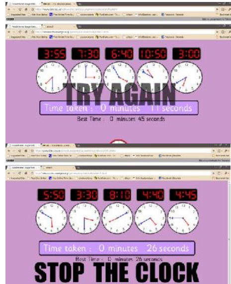
Gambar 3 : Stop The Clock

Permainan ini meminta pemain memasang jam digital dengan jam analog dengan cara men-drag atau memindahkan kotak berisi jam digital ke atas jam analog yang bersesuaian seperti diilustrasikan pada Gambar 8. Di bawah gambar jam analog, terdapat pencatat waktu yang dapat merekam waktu yang diperlukan pemain untuk menyelesaikan permainan tersebut. “ TRY AGAIN ” adalah umpan balik yang diterima pemain jika pemain salah dalam mencocokkan jam digital dengan jam analog. “ STOP THE CLOCK ” akan muncul jika pemain benar mencocokkan seluruh jam yang ada. Dengan demikian, melalui permainan ini anak bisa juga melatih kecepatan dalam menjawab soal-soal matematika. Permainan ini dapat diakses melalui http://resources.oswego.org/games/stoptheclock/sthec3.html .