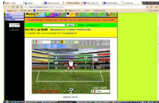
Gambar 11: Game World Cup dengan soal penjumlahan

www.mrnussbaum.com/football/index.html .