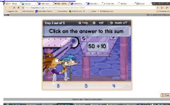
Gambar 1: Division Mine

Dengan setting meletakkan barang tambang ke dalam bak-bak sejumlah hasil dari operasi bilangan-bilangan pada permainan ini, pemain harus menjawab secara benar pertanyaan yang ditampilkan dengan cara mengeklik satu dari tiga pilihan jawaban yang disediakan di bagian bawah permainan. Dengan demikian, website permainan ini dapat digunakan untuk melatih mental math pada pembagian. Berikut Gambar 2 yang menampilkan permainan Division Mine dan dapat diakses di alamat http://bbc.co.uk/schools/ks1bitesize/numeracy/division/fs.shtml .