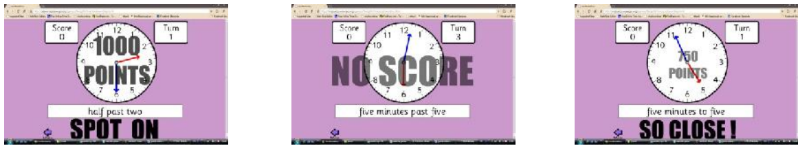
Gambar 9 : Bang On Time