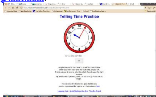
Gambar 4: Telling Time Practice

Pada permainan Telling time to practice ini, pemain diminta menggerakkan letak jarum panjang dan pendek jam sesuai dengan perintah yang tertulis di bawah jam. Wow! , Great , dan Super adalah beberapa ucapan untuk pemain yang berhasil menempatkan jarum jam secara tepat. Ask your parents akan diterima pemain jika belum berhasil menjawab betul 10 soal pada permainan ini. Permainan ini beralamat di www.worsleyschool.net/socialarts/tellingtime.html .