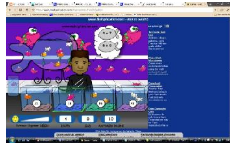
Gambar 5: Fantastic Fish Shop

www.multiplication.com/flashgames/FishShop.htm .