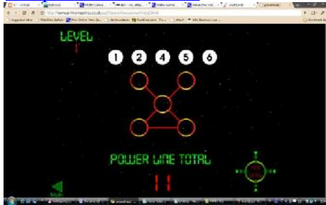
Gambar 7: Power Line

www.primarygames.co.uk/pg2/powerlines/powerlines1.html .