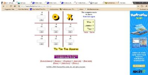
Gambar 8: Tic Tac Toe Squares

Pemain dapat memenangkan permainan yang beralamat di www.funbrain.com/cgi-bin/ttt.cgi ini jika berhasil menghasilkan tanda X dalam satu baris secara horizontal, vertikal, dan diagonal. Untuk menghasilkan tanda X, pemain harus menjawab benar soal yang disajikan. Berikut tampilan Game Tic Tac Toe Squares .