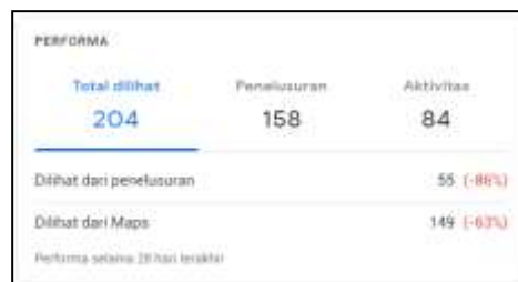
Gambar 12. Jumlah Penelusuran Google Bisnisku

Pengaruh dari pengunjung setelah dibuatnya akun Google Bisnisku Omah Rias Cantika yaitu bertambahnya jumlah pengunjung yang melakukan perawatan maupun jasa make up secara online. Pengunjung dapat mengetahui informasi melalui Google Bisnisku melalui search tool di internet seperti yang terlihat pada gambar berikut ini.