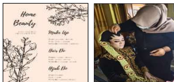
Gambar 3. Jasa Make Up yang Ditawarkan

Adapun koleksi yang dimiliki oleh unit usaha kecantikan Omah Rias Cantika seperti busana pengantin nasional dan modern, kosmetik rias wajah, perlengkapan perawatan wajah, rambut serta badan. Fasilitas di unit wirausaha kecantikan Omah Rias Cantika yaitu pelayanan make up, facial/perawatan badan. Untuk pelayanan kepada konsumen dapat dilakukan secara mobile. Jasa Make up yang ditawarkan bervariasi seperti jasa make up untuk pesta, wisuda, pengantin dengan biaya yang terjangkau.