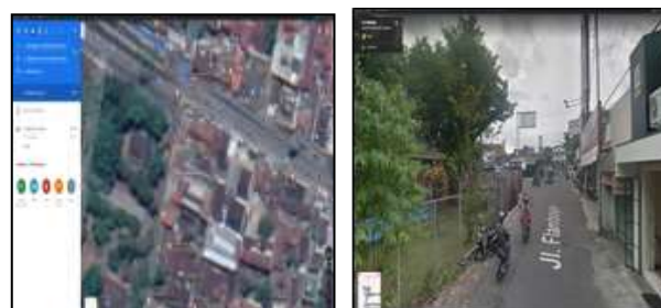
Gambar 7. Fitur Google Map

Google Bisnisku menyediakan fitur Google Map yang dapat diakses secara online dengan kapasitas visibilitas yang cukup tinggi. Fitur ini melisting gambar denah lokasi sehingga pelanggan tidak perlu menggunakan peta tradisional atau menulis tujuan saat mereka mencari lokasi unit wirausaha Omah Rias Cantika.