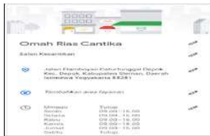
Gambar 2. Jam Layanan Konsumen

Layanan di unit usaha kecantikan Omah Rias Cantika diperuntukan bagi warga Universitas Negeri Yogyakarta maupun masyarakat umum. Unit usaha Kecantikan Omah Rias Cantika menyediakan jasa MUA, pengantin, dan penyewaan busana pengantin. Waktu kunjungan unit usaha yaitu pada hari Selasa-Jumat pada pukul 09.00-16.00 WIB, hari Sabtu dan hari libur nasional Omah Rias Cantika tidak membuka layanan konsumen.