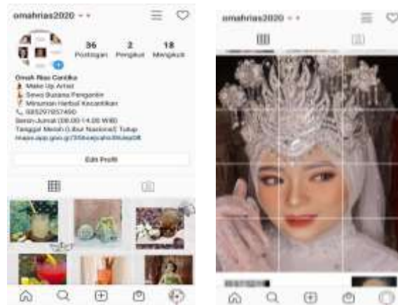
Gambar 9. Tampilan Omah Rias di Instagram

Aplikasi Google Bisnisku dapat dihubungkan ke akun media sosial lain yang dimilikinya, sehingga bila pengguna memposting foto otomatis muncul di akun lain yang dihubungkannya. Hal tersebut dapat membantu mempromosikan ke pengguna media sosial selain platform Google Bisnisku yaitu Instagram Omah Rias Cantika. Hal ini sangat membantu mempromosikan ke masyarakat yang tidak mengakses Google Bisnisku Berikut tampilan halaman Instagram Omah Rias Cantika.