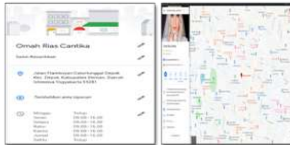
Gambar 4. Akun Google Bisnisku Omah Rias Cantika

Konten merupakan suatu hal yang terpenting dalam proses promosi yang berisikan informasi yang ada di dalam media promosi berupa gambar ataupun video. Nama akun Google Bisnisku yang digunakan yaitu Omah Rias Cantika seperti yang terlihat pada gambar berikut ini.