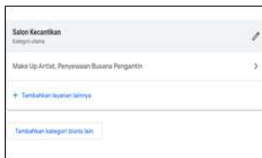
Gambar 8. Produk Online Omah Rias Cantika

Peneliti dapat sekaligus menggunakan beberapa jenis konten efek pada aplikasi Google Bisnisku yang membuat suatu kiriman hasilnya menjadi lebih menarik seperti pada gambar berikut ini.