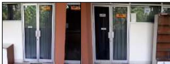
Gambar 1. Tampilan Depan Omah Rias Cantika

Unit usaha Omah Rias Cantika didirikan oleh Prodi Tata Rias dan Kecantikan UNY pada bulan Januari tahun 2015 sebagai wujud aktualisasi semangat kewirausahaan mahasiswa dan juga sebagai unit usaha yang bertujuan memperkenalkan prodi tata rias dan kecantikan kepada masyarakat.