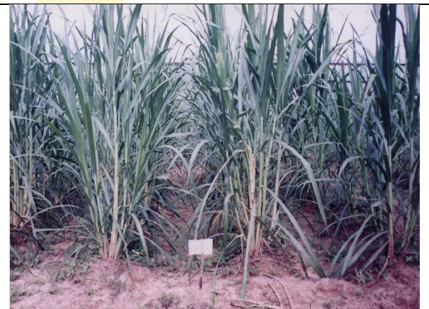
Gambar 2. Rumput Raja