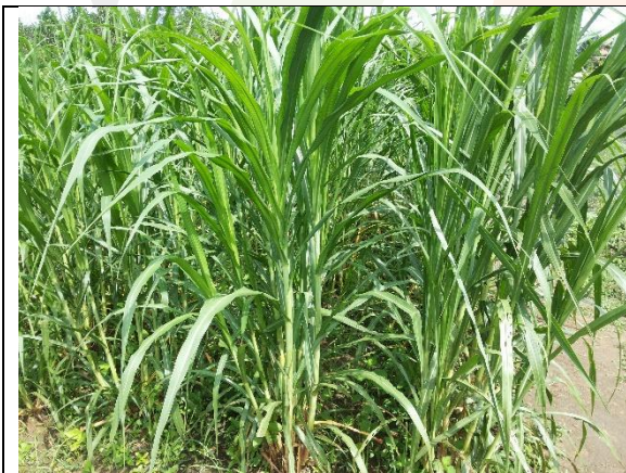
Gambar 1. Rumput Raja

Berdasarkan hasil pengamatan dan identifikasi di lapangan, menunjukkan bahwa pemberian hijauan pakan di Desa Sukadarma hanya mengandalkan hijauan/rumput alam yang tumbuh disekitar pekarangan rumah, kebun sawit sebagai pakan ternak kambing, ini bisa kita maklumi karena belum ada hijauan unggul yang dibudidayakan. Seperti diketahui bahwa rumput alam yang tumbuh secara liar, baik dari segi produksi maupun secara kualitas nilai nutrisinya sangat rendah, oleh karena itu perlu adanya introduksi rumput unggul. Salah satu jenis rumput unggul yang potensial untuk dikembangkan di Desa Sukadarma adalah rumput raja ( Pennisetum purpuphoides ) atau lebih dikenal king grass Budidaya rumput raja dan gajah dapat dilihat pada gambar di bawah ini.