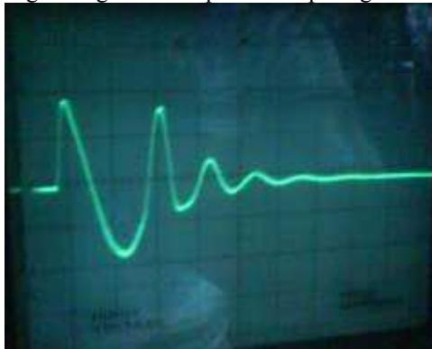
(a) kondisi normal

Perbandingan Bentuk gelombang saat pengujian dengan surge tester dapat dilihat pada gambar 3.1