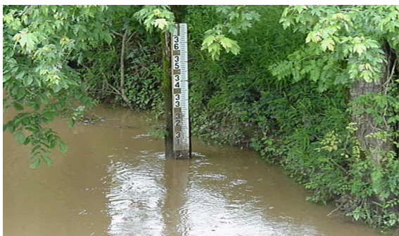
Gambar II.2. Staff Gauge

waktu setempat, apabila diperlukan frekuensi pengukurannya dapat ditambah, terutama selama terjadi banjir agar data muka airnya lebih lengkap. Banyaknya pengukuran tinggi muka air setiap harinya tergantung dari banyaknya faktor, antara lain : besarnya fluktuasi muka air, tersedianya dana untuk honor pengamat, dan ketelitian yang diinginkan. Pengamat secara teratur harus melaporkan datanya kepada instansi hidrologi yang berwenang. Pelaporan harian dapat dilaksanakan menggunakan telepon atau teletype , apabila datanya sangat segera diperlukan. Pelaporan bulanan atau mingguan, data muka air dapat dikirim melalui kantor pos terdekat atau diambil setiap tiga bulan sekali oleh petugas.