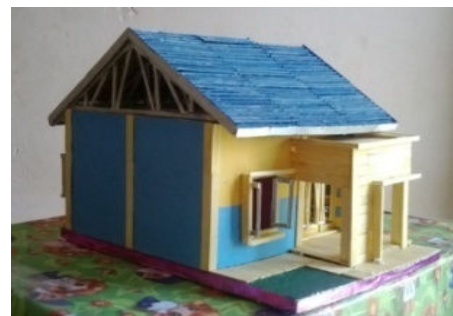
Gambar 1. Miniatur Rangka Atap Baja

Untuk memudahkan melihat perbedaan penempatan rangka kayu dan rangka atap baja dirumah tipe 36, dibuatlah miniatur rumah dengan menggunakan bahan sederhana berupa karton padi, styrofoam, stik es krim, lem cina, lem fox, kertas warna, kertas kado, kertas minyak, cat kayu, double tip, karter, gunting, isolasi, kardus.