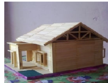
Gambar 2. Miniatur Rangka Atap Kayu