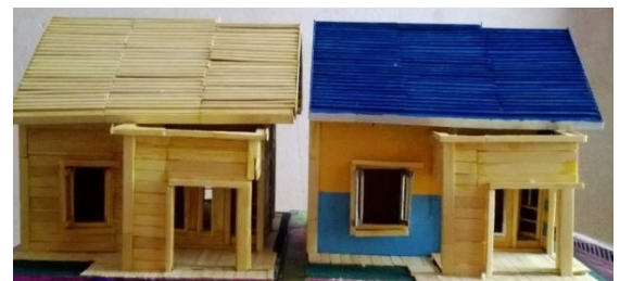
Gambar 3. Miniatur Rumah dengan Rangka Atap-Kayu dan Rangka Atap Baja

Pembuatan miniatur rumah ini dimaksudkan untuk membantu para konsumen untuk mengetahui beda pemasangan rangka atap dari kayu maupun dari baja. Sehingga dapat di jelaskan keunggulan dari rangka baja dibandingkan rangka kayu, karena disadari kalau penggunaan kayu sebagai bahan