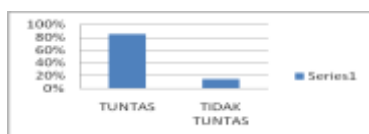
Gambar 2. Nilai Akhir Siswa pada Soal Materi Hidrokarbon

Siswa diberikan soal akhir materi hidrokarbon pada pertemuan terakhir, namun materi yang dijadikan pertanyaan hanya materi hidrokarbon yang telah dipraktikumkan. Berikut Gambar grafik data nilai siswa pada test akhir materi hidrokarbon.