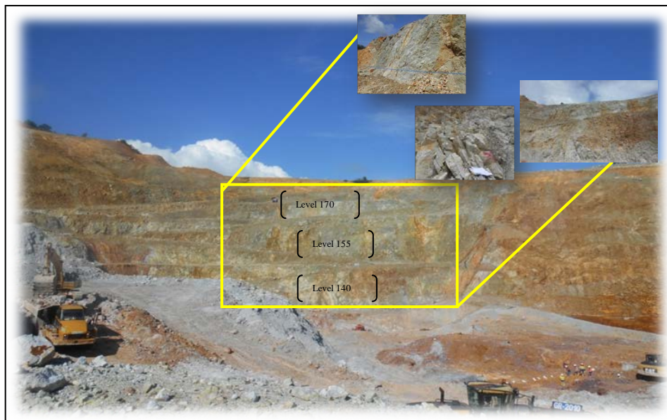
Gambar 3. Kondisi Lereng Pada Lokasi Penelitian.